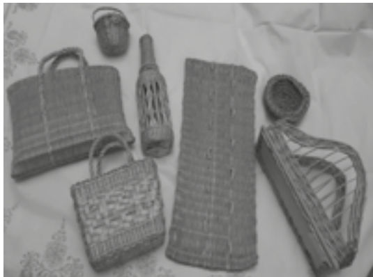
Használati tárgyak gyékényből, vesszőből