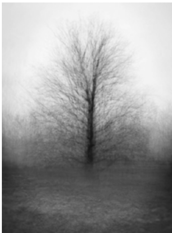
Archetípusok fotósorozat színes

Fotóművészet, 2009/3 LII. ÉVFOLYAM 3. SZÁM