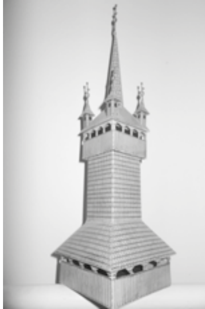
Nemesborzova – Harangláb MMKI alapján papírmakett