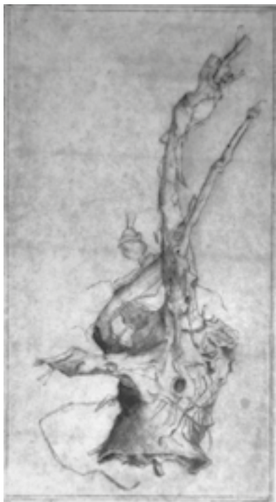
Pinokkió hidegtű és diópác

2009-ben a Pedagógus Szakszervezet Csongrád Megyei Szervezetének Díja