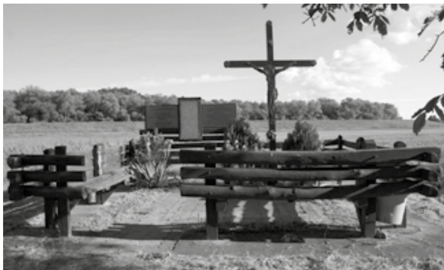
A pajori iskola emlékhelye dokumentumfotó

1947-ben születtem Hódmezővásárhelyen. A József Attila Tudományegyetemen kémia-fizika szakos tanárként végeztem. 45 éve élek Makón. Fényképezéssel diákkorom óta foglalkozom. Munkáim folyóiratokban, legutóbb a Honismeret folyóirat 2015/2. számában, kiadványokban, pl. a CSMHE évkönyveiben, a Makói Honismereti Híradóban, továbbá az általam szerkesztett honlapokon jelentek meg. Az utóbbiak közül a honismerethez az Eltűnt tanyai iskolák emlékezete ( http://eltuntiskolak.uw.hu ) című kapcsolódik, amelyben a hagyományos tanyavilággal együtt eltűnt intézmények alapítóinak, fenntartóinak és tanítóinak kívántam emléket állítani, alapvetően a fényképes dokumentáció eszközével. A most kiállított anyagomat is e honlap 2014 és 2015 között készült fényképeiből válogattam.