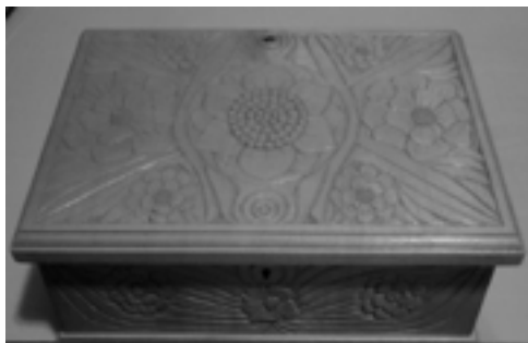
Ékszeres kazetta fafaragás, juharfa

Csongrád-Feketevár kutatásának és fametszete elkészítésének története 1992-2008. In.: Tanulmányok a csongrádi Feketevárról, Csongrád 2009. 193-200. pp.