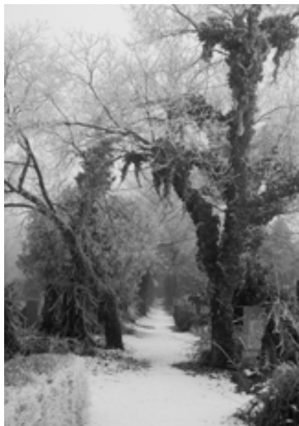
Zsidó temető dokumentumfotó