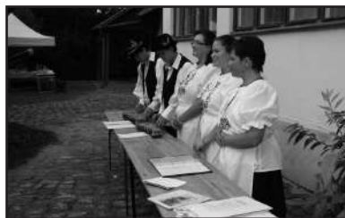
A Dorozsmai Búzakalász citera zenekar