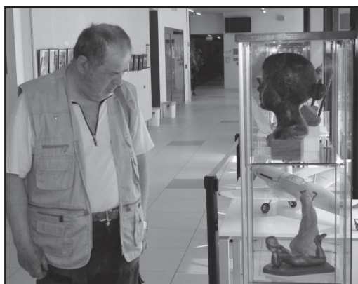
A kiállítás részlete egy nézelődővel