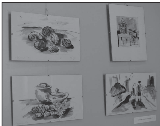
Dobayné Deák Éva grafikái