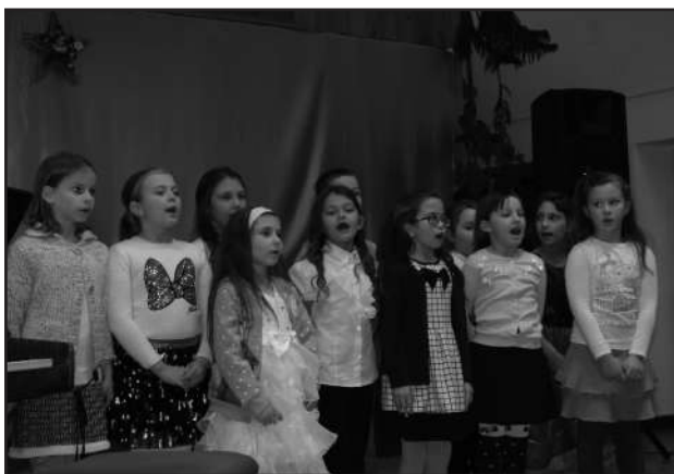
Kicsinyek kórusa a megnyitón