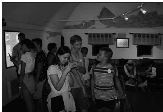
A török ház minden részletét le kellett fotózni

szegedi Dugonics András Piarista Gimnázium két tanulója és a makói József Attila Gimnázium három diákja ugyan nem szerepelt az akadémián előadással, de minden közösségi programon örömmel vett részt és rengeteg ismeretet szerzett. Az akadémián nem csak beszéltek a helyi ételekről, hanem Szigetvár környéki hagyományos ételekből állították össze a vacsorákat is: ettünk bosnyák vacsorát, nagydobszai töltött káposztát a Talpasházban, amelynek a receptjét is megkaptuk fénymásolatban, szerdán délután a szigetvári várkertben háromféle bográcsos ételt főztek helybeli asszonyok és férfiak, s a készítésnél az akadémia fiataljai is kuktáskodtak természetesen mindegyik remekművet alaposan végig kóstolgatva. A csütörtöki kirándulás végén pedig kukoricalevessel és csebényi birkapörkölttel vendégelték meg az akadémia valamennyi résztvevőjét Csebényben, s amíg elké-