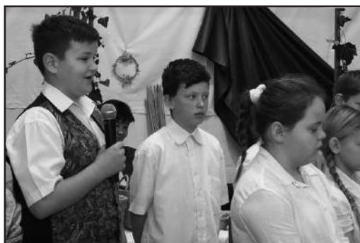
A csongrádi verseny résztvevői