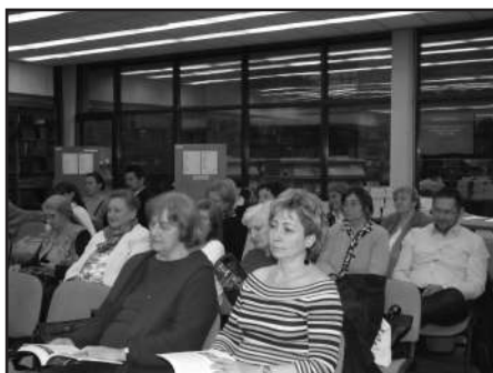
A könyvbemutató résztvevői