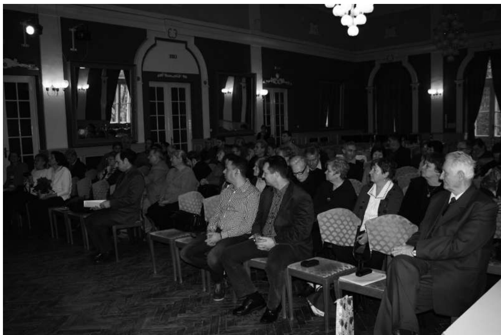
Csongrád megyei Honismereti Egyesület jelenlévő tagjai