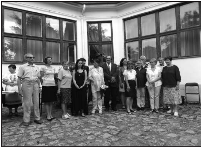
Alkotó honismerőink Makón