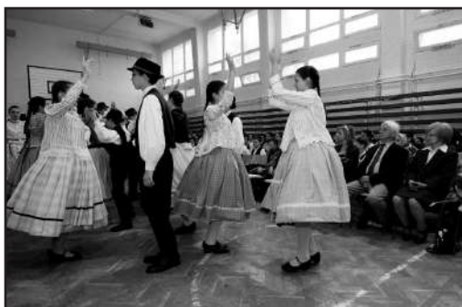
Táncosok a javából a versenyen