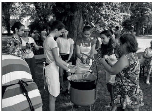
Főzés a várkertben

szegedi Dugonics András Piarista Gimnázium két tanulója és a makói József Attila Gimnázium három diákja ugyan nem szerepelt az akadémián előadással, de minden közösségi programon örömmel vett részt és rengeteg ismeretet szerzett. Az akadémián nem csak beszéltek a helyi ételekről, hanem Szigetvár környéki hagyományos ételekből állították össze a vacsorákat is: ettünk bosnyák vacsorát, nagydobszai töltött káposztát a Talpasházban, amelynek a receptjét is megkaptuk fénymásolatban, szerdán délután a szigetvári várkertben háromféle bográcsos ételt főztek helybeli asszonyok és férfiak, s a készítésnél az akadémia fiataljai is kuktáskodtak természetesen mindegyik remekművet alaposan végig kóstolgatva. A csütörtöki kirándulás végén pedig kukoricalevessel és csebényi birkapörkölttel vendégelték meg az akadémia valamennyi résztvevőjét Csebényben, s amíg elké-