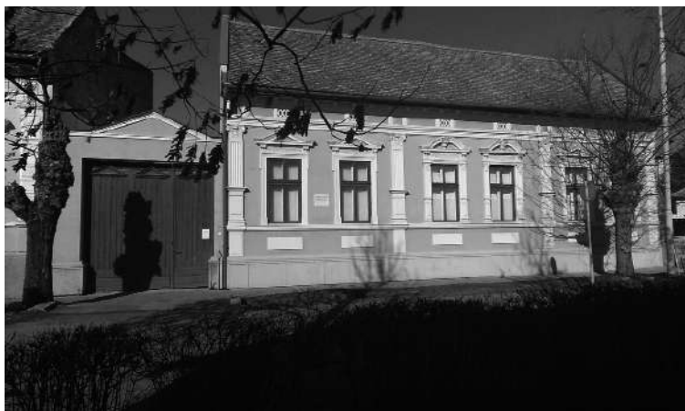
Makó, Espersit - ház