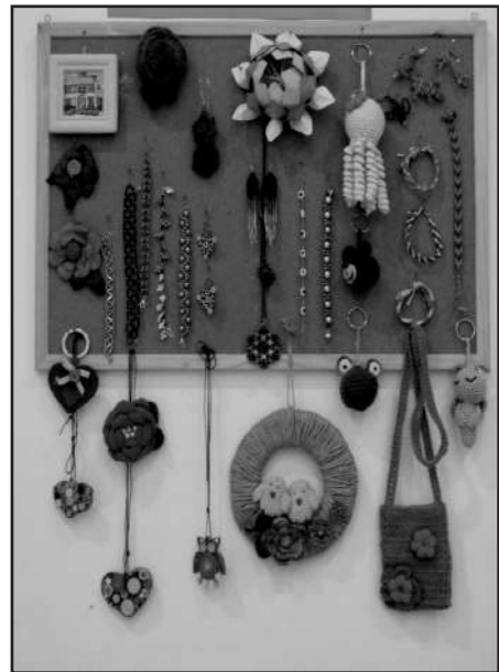
A Dorozsmai Kiscinkék zsengei