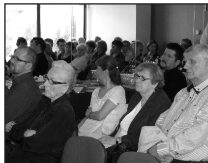
Résztvevők az Agórában