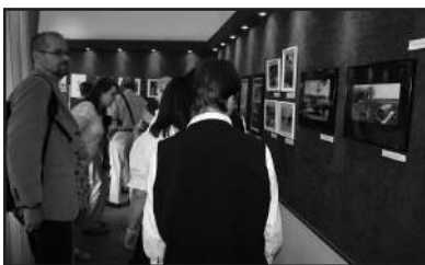
A kiállítást szemlélve