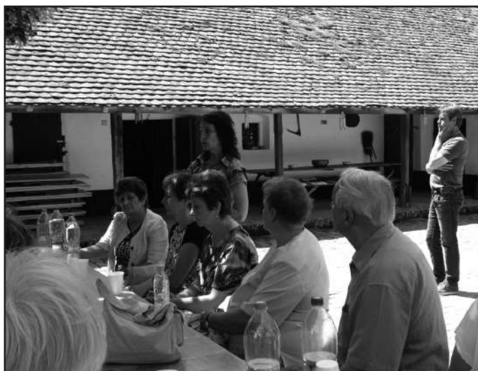
Sonkoly Ágneset hallgatva