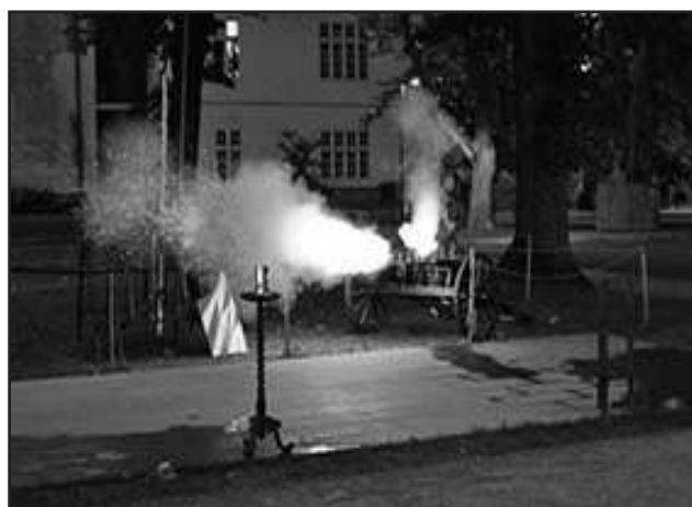
Ágyútűz a fegyverbemutató végén

hozott süteménykülönlegességekkel vendégelték meg egymást a fiatalok. Másnap a Várbaráti Kör tagjai városnézésen megismertettek bennünket Szeged nevezetességeivel: különösen szép élményt nyújtott a gyönyörű török tárgyakkal berendezett XVI. századi török ház, eredeti nevén Karavánszeráj, meglepő volt a kívül török dzsámi, belül keresztény templom épülete, valamint a szálloda közelében álló Ferencesek temploma, amelynek harangütéseit minden órában négyszer lehet hallani, éjszaka is. Mindenki lefotózta a kőoroszlán szobrát, tetszett a Vigadó és a Sóház, a város több helyén is látható Zrínyi Miklós-szobrok, a nemzetiségi gyűjtemény. Maga a vár nagy park-