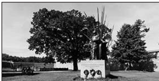
A hős várvédők emlékműve