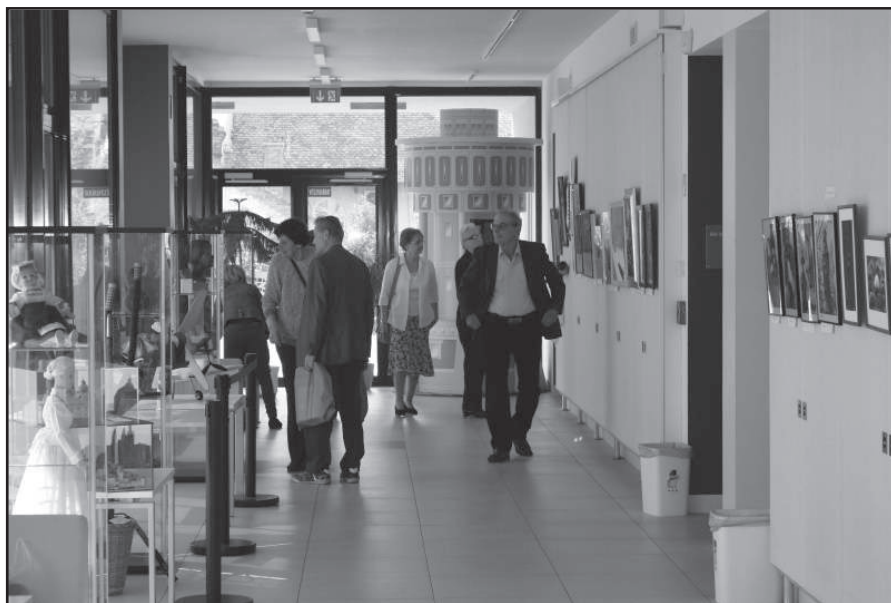
A kiállítás részlete