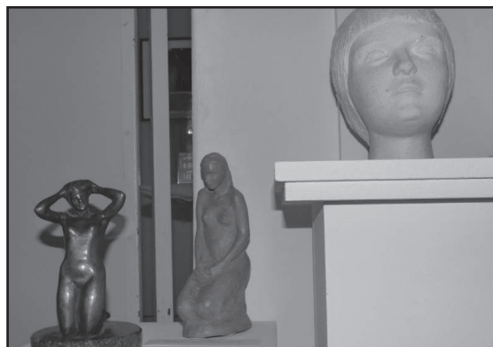
Kruzsliz István alkotásai