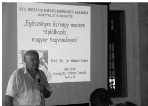
Gundel János professzor emeritus előadása

A nyitó előadást Gundel János professzor emeritus tartotta Egészséges és/vagy modern táplálkozás, magyar hagyományok címmel. Először több olyan kérdés felvetésével keltette fel a fiatalok érdeklődését, amelyek mindenkiben felmerülhetnek a táplálkozás kapcsán: Korszerű – egészséges – modern? Honnan lehet tudni, mi az? Tudományos – áltudományos felfogások az étkezéssel kapcsolatban? Kinek a véleményére lehet, szabad hallgatni? Csak a szakemberekére. Kiemelte, hogy sajnos nincsenek táplálkozástudományi tanszékek a magyar egyetemeken, ill. sokan nem ismerik az élelmezési törvény szabályozásait. Szólt a média reklámtevékenységének és a hagyományos