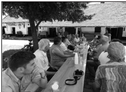
A Tájház udvarán