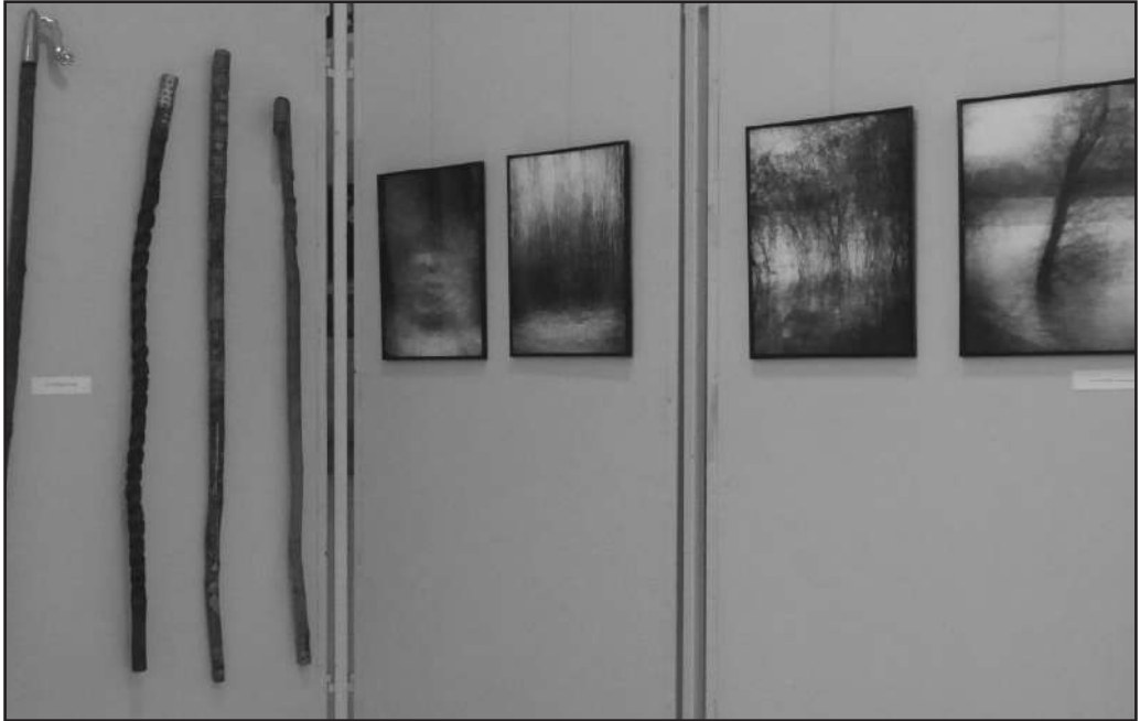
Pál Richárd fotói, Nagy Gábor pásztorfaragásai