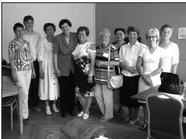
Az akadémia nyitó napján jelenlévő tagjaink

Július 6-án az Akadémia zárása következett és ki lett jelölve a következő akadémiai helyszín is. Találkozunk jövőre Nyíregyházán!