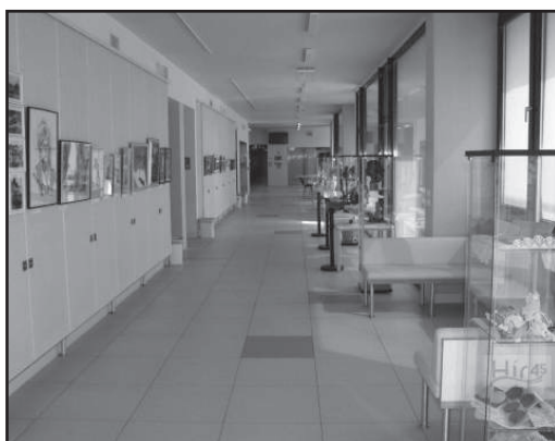
A kiállítás részlete