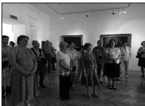
A Tornyai János Múzeumban