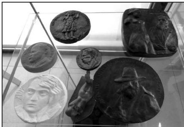
Kruzslicz István kisplasztikái