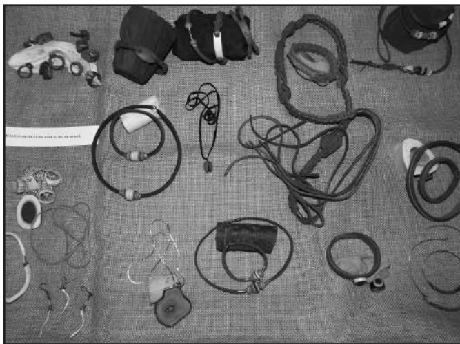
Dr.Ávéd János "bio" ékszerei