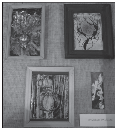
Kovács Lajos alkotásai