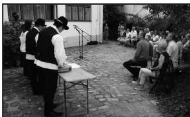
A megnyitó közönsége