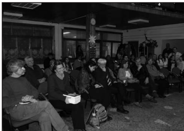
A megnyitó résztvevői